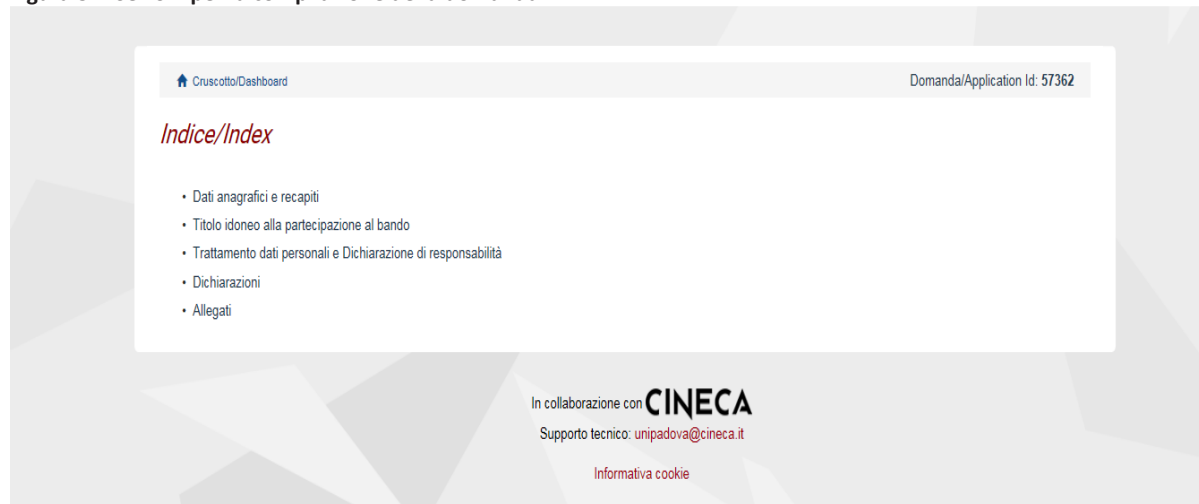
Figura 5 – Sezioni per la compilazione della domanda.

3.1 DATI ANAGRAFICI: il candidato troverà precompilata questa parte con i dati già inseriti nella procedura di registrazione, deve pertanto compilare i campi mancanti (iscrizione liste elettorali, residenza, recapito ai fini del bando, recapiti telefonici e telematici ai fini del bando) (fig. 6). Nel caso ci fossero errori nei dati anagrafici il candidato può modificarli accedendo in alto a destra nel "Profilo utente".