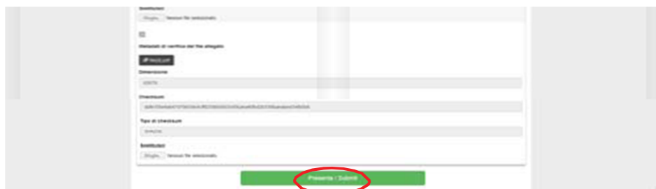
Figura 14 – Presentazione della domanda

A questo punto vengono proposte tre modalità di firma e il candidato deve selezionarne una e seguire attentamente le istruzioni (fig.15)