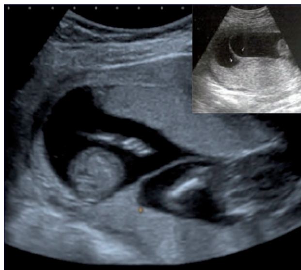
Figura 1. Segno lambda.

Il quadro ecografico nel I trimestre, preferibilmente dopo le 6 +7 settimane, quando è più semplice distinguere la membrana amniotica dal celoma extraembrionale, è caratterizzato da due differenti placente e da due differenti sacchi amniotici, ognuno delimitato da un proprio corion e da una propria membrana amniotica. Se le due placente sono totalmente separate, la diagnosi di corionicità è semplice, poiché si distinguono due distinti piatti placentari. Se invece le due placente sono conti-